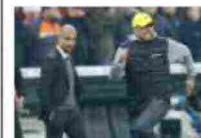
Coppa di Germania: il Dortmund batte il Bayern ai rigori e va