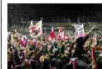
Festeggiamenti per la promozione del Carpi in serie A