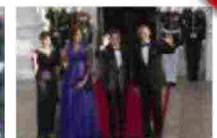
Obama riceve il premier Shinzo Abe alla Casa Bianca