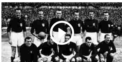
Grande Torino, 72 anni fa la tragedia di Superga