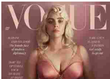
Dalle tute sportive al latex Billie Eilish in intimo su Vogue "Fiera di essere una sguadrina"