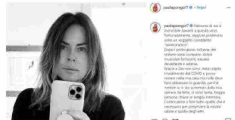
Paola Perego positiva al Covid: "Nausea devastante e astenia"