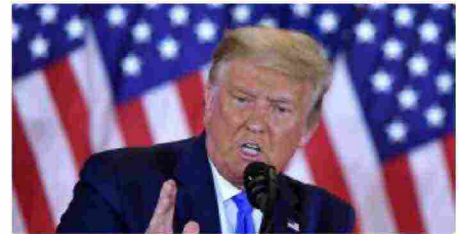
Elezioni Usa, Trump twitta: "Fermate il conteggio"