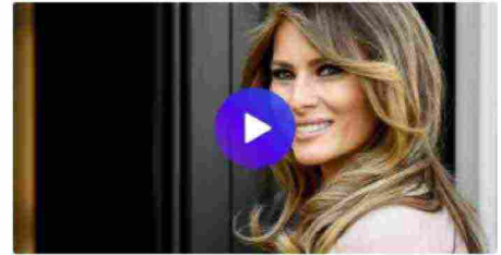
Camion dei traslochi alla Casa Bianca: scoppia ironia su Melania Trump e l'esito delle elezioni USA