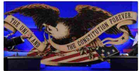
Usa 2020, la corsa alle presidenziali minuto per minuto