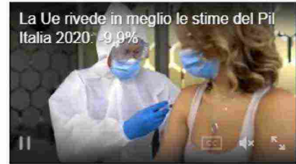
La Ue rivede in meglio le stime del Pil Italia 2020: -9,9%