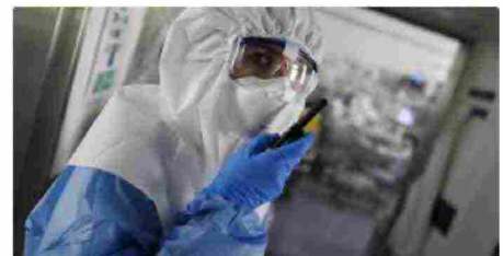
Coronavirus: vittime, contagi e tutte le news in tempo reale